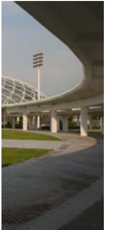
健康回廊北望体育馆