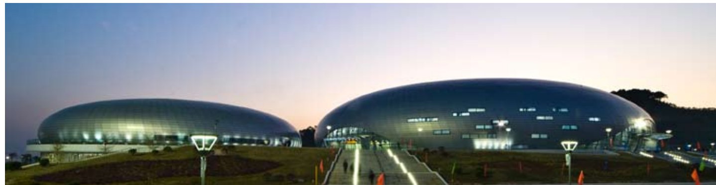
广州市花都东风体育馆