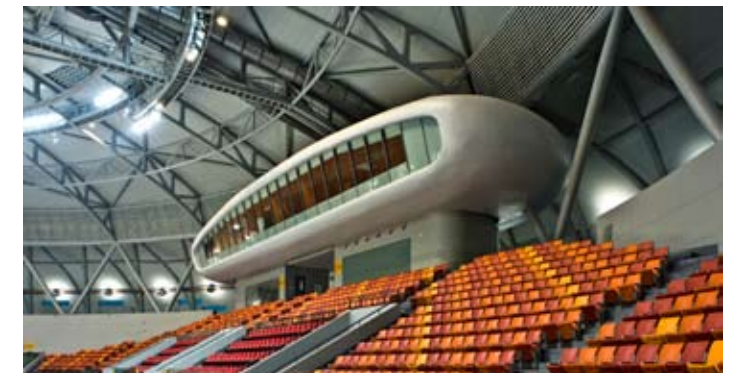
广州市花都东风体育馆-飘楼