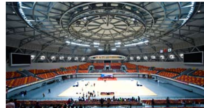
广州市花都东风体育馆-比赛场地