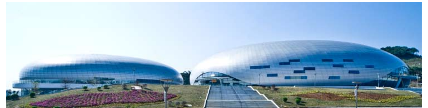
广州市花都东风体育馆