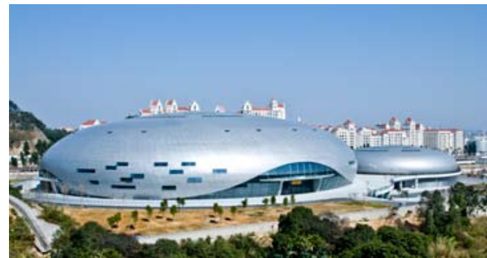
广州市花都东风体育馆