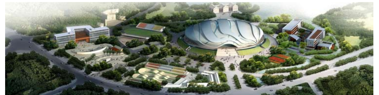
广州自行车轮滑极限运动中心-总体鸟瞰效果图