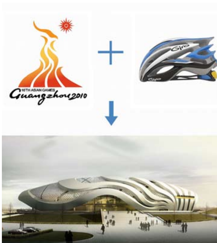
自行车馆设计概念演变