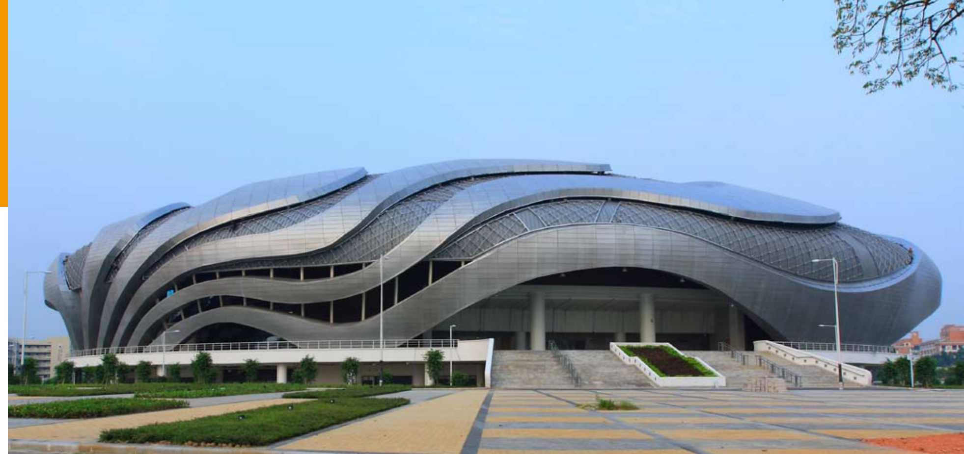
自行车馆西入口实景