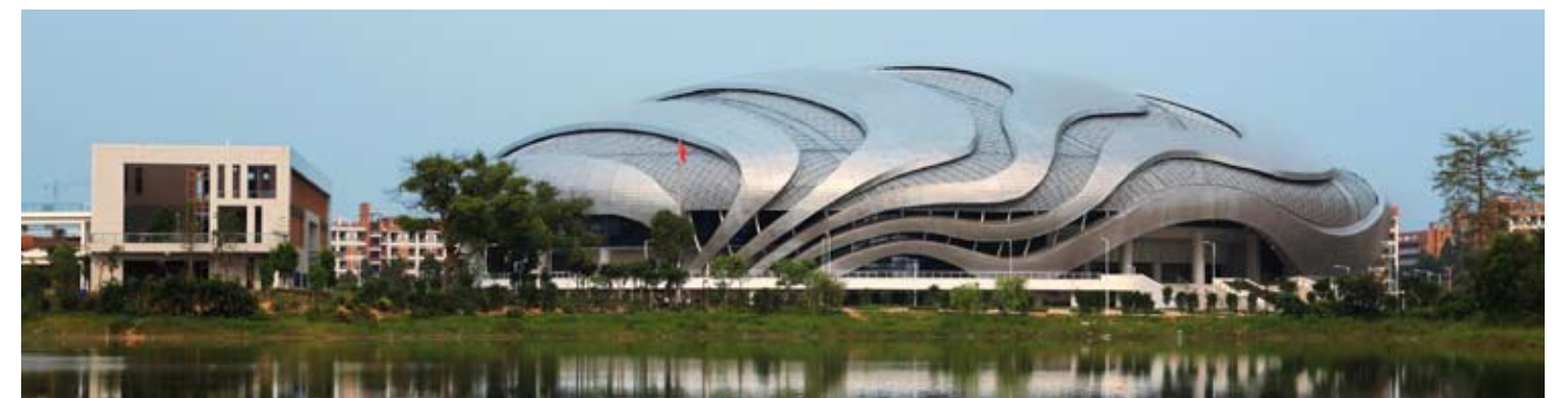
自行车馆湖畔实景