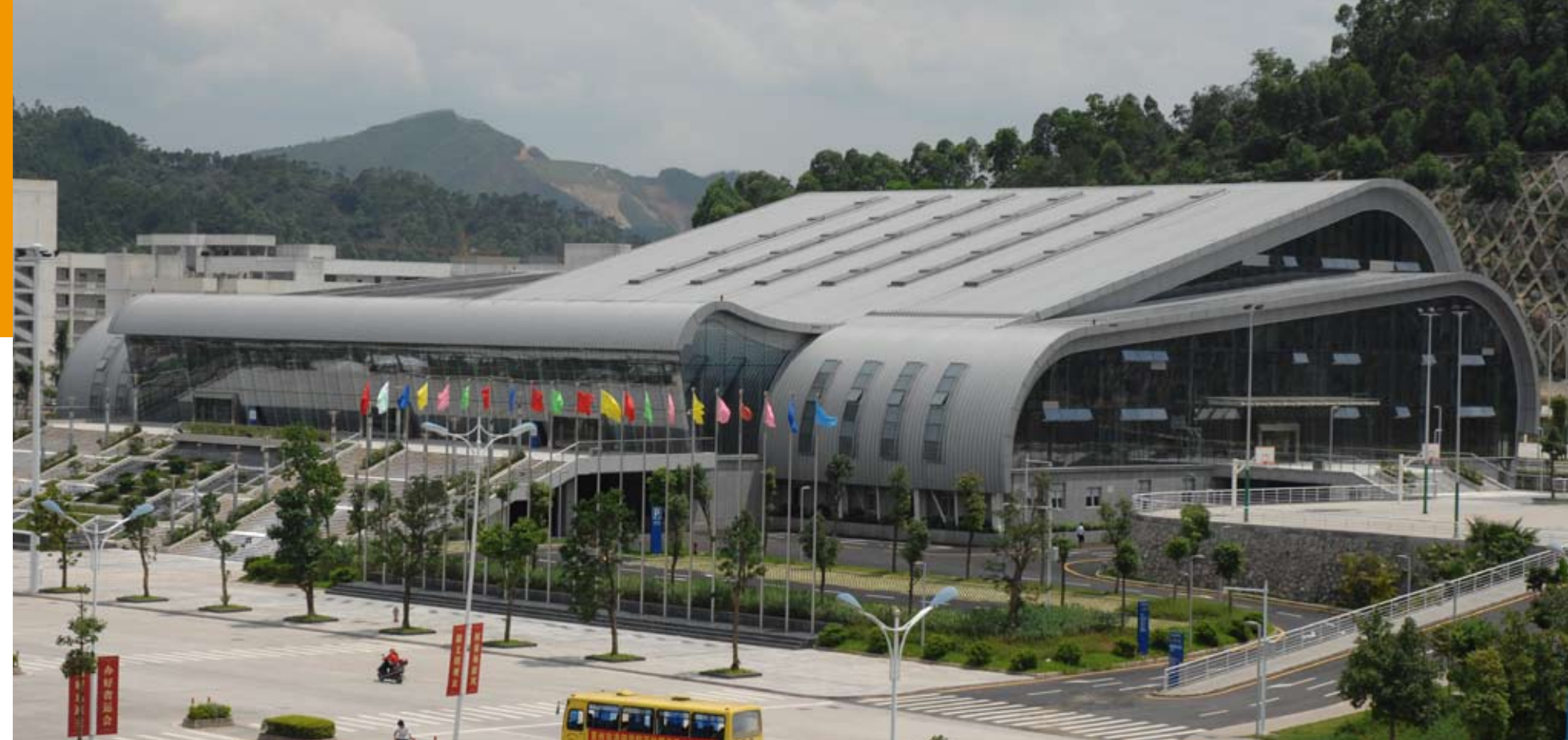
金山湖体育馆外观