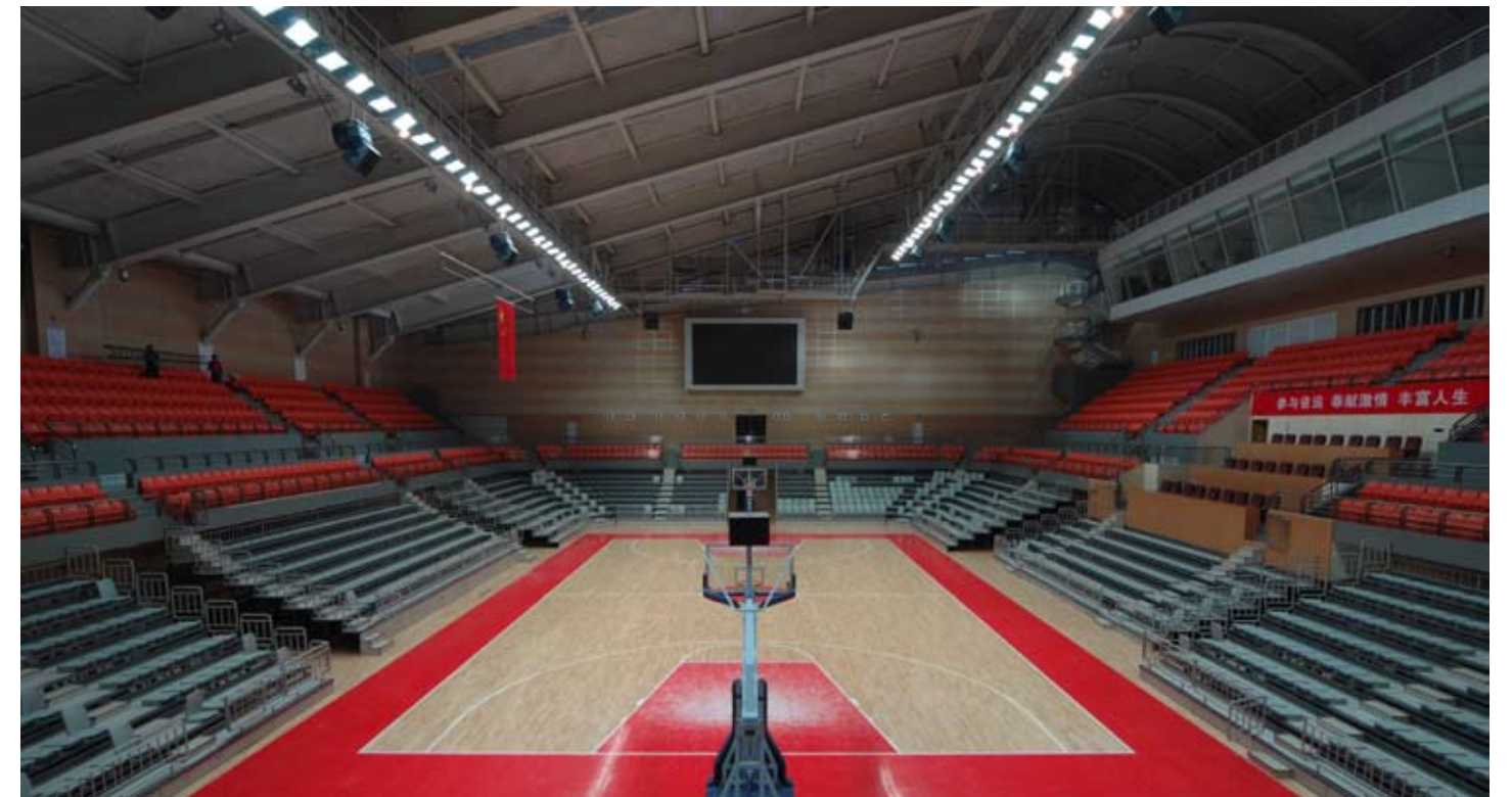
金山湖体育馆-主赛馆