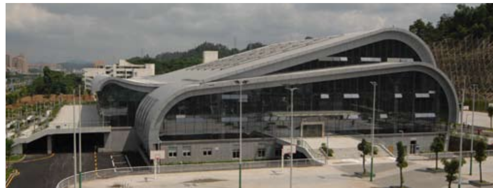
金山湖体育馆-侧面