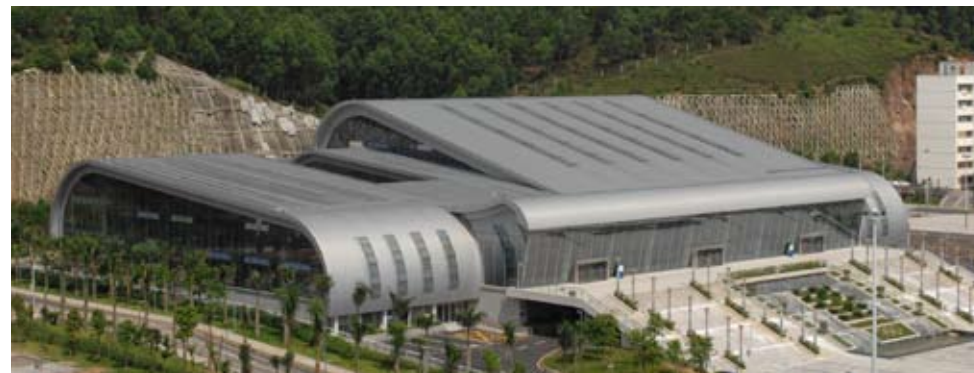
金山湖体育馆外观