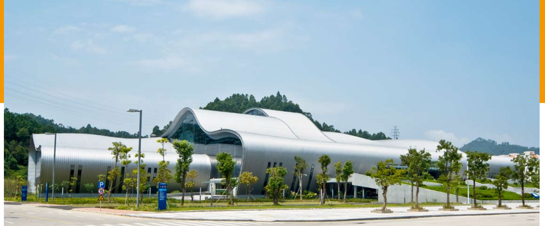
惠州市游泳馆实景