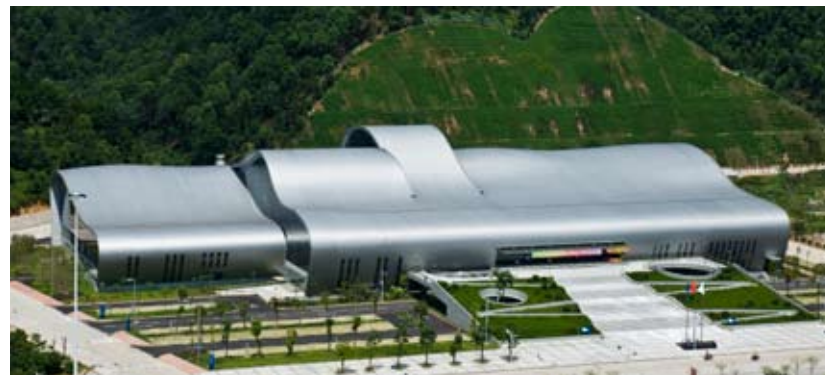
惠州市游泳馆鸟瞰实景