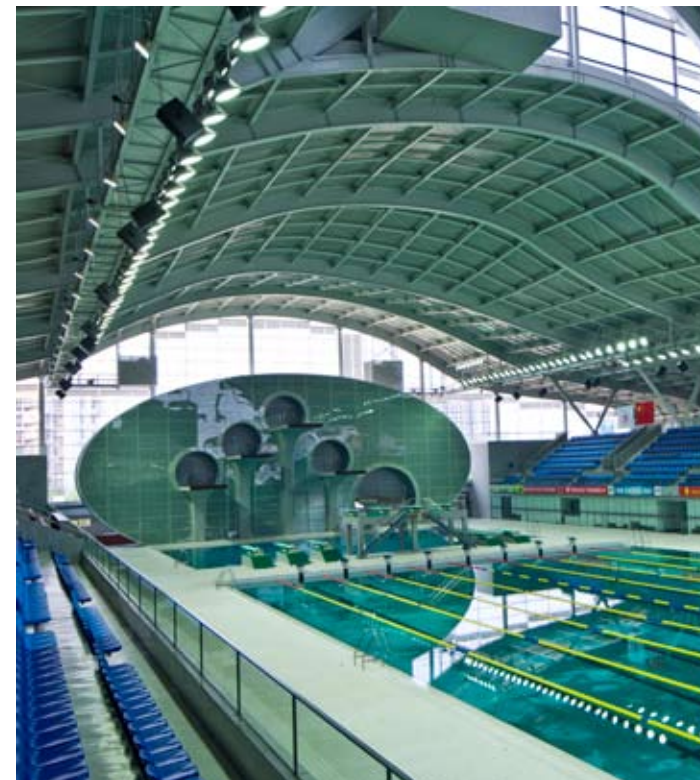
惠州市游泳馆室内