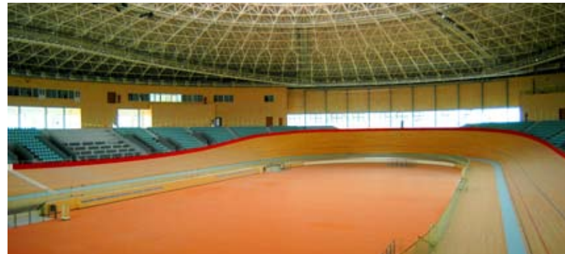
自行车馆室内场馆实景