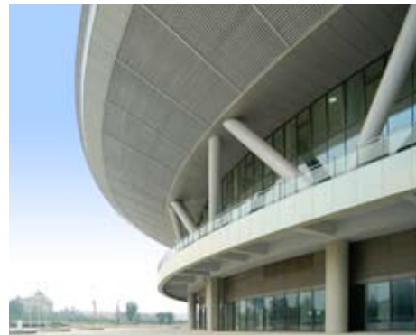
2008奥运老山自行车馆实景